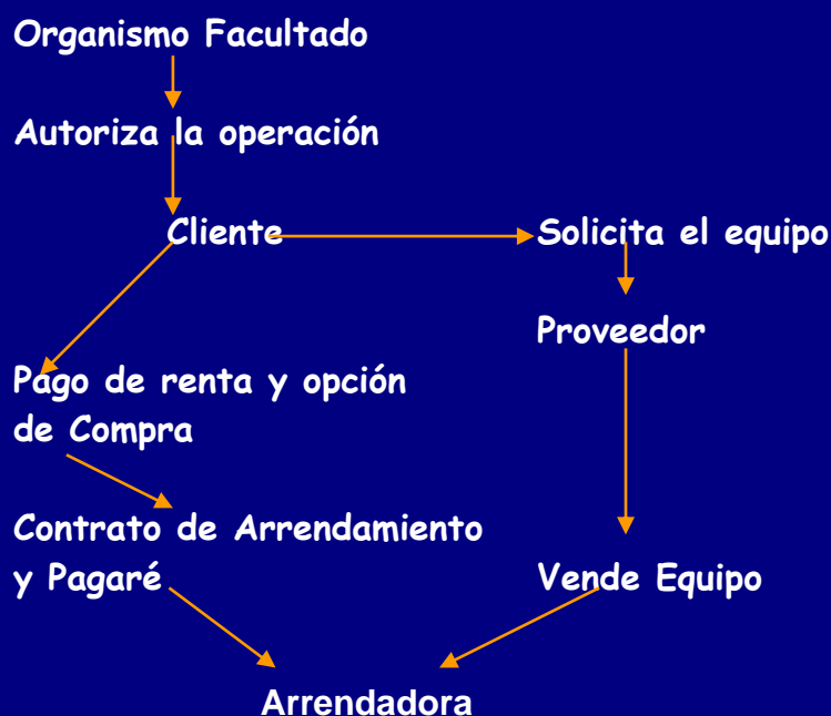
DIAGRAMA DE ARRENDAMIENTO

Leasing Operativo, Leasing en Divisas, Leasing con subarriendo, Leasing inmobiliario, Leasing Financiero, Leasing Puro.