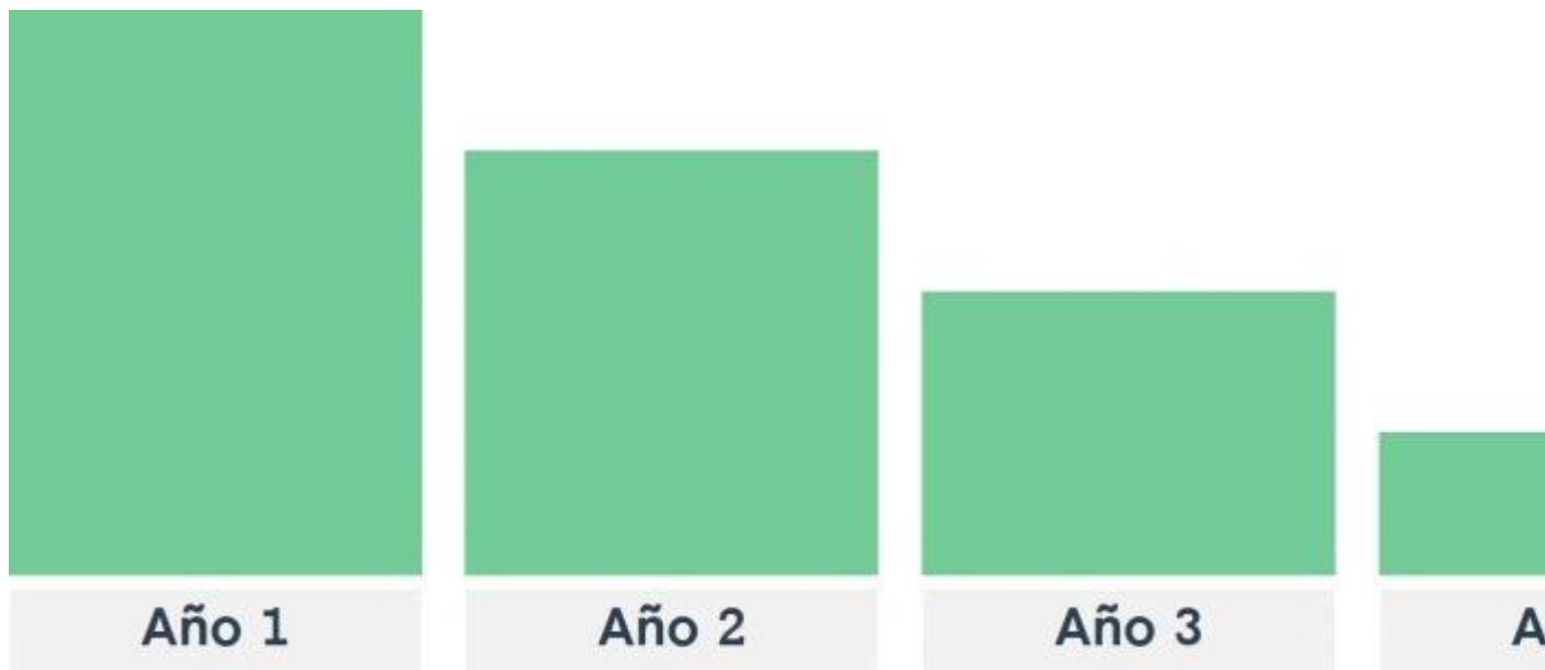
CAPEX de mantenimiento

El CAPEX de reposición mantiene nuestra capacidad productiva actual. Por ejemplo, cuando cambiamos un camión que ya no funciona por uno nuevo. En teoría, este CAPEX de mantenimiento debería coincidir con las amortizaciones: cuando termino de amortizar un activo tengo que realizar una nueva inversión para reponerlo.