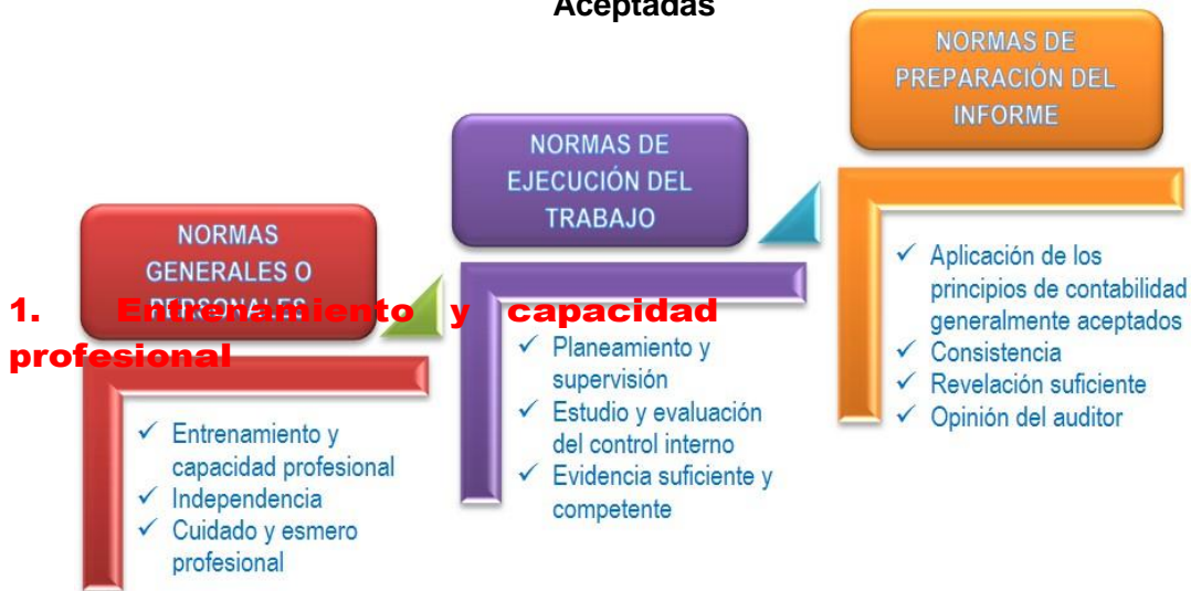
Clasificación de las Normas de Auditoría Generalmente Aceptadas

“La auditoría debe ser efectuada por personal que tiene entrenamiento técnico y pericia como auditor”